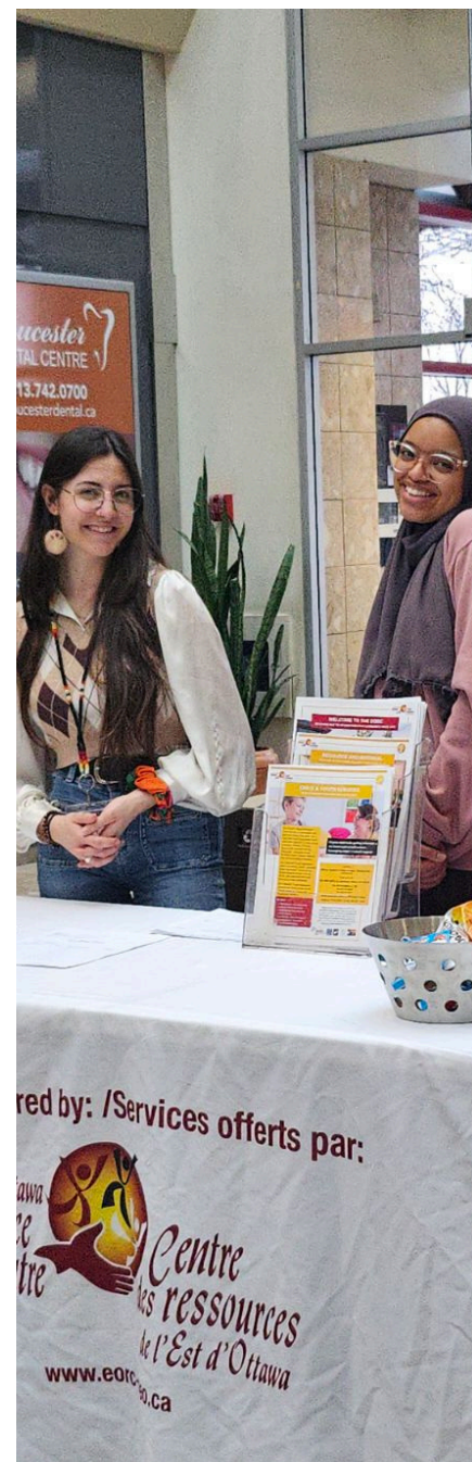
Salon des ressources pour l'emploi des jeunes

Les consultations des résidents ont également révélé que les enfants, surtout les nouveaux arrivants sans médecin de famille, avaient du mal à obtenir les vaccins de routine. En partenariat avec Santé publique Ottawa, nous avons intégré ce service à un site de vaccination COVID-19 existant dans un carrefour santé, accessible à des milliers de familles.