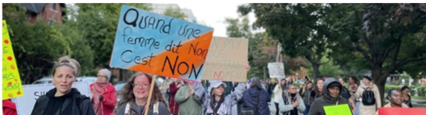
Marche « La rue, la nuit, les femmes sans peur »

La travailleuse de soutien à la cour de la famille a aussi contribué à une étude de l'Université de Guelph sur la violence entre partenaires intimes et s'est jointe au Comité d'examen des cas de violence domestique.