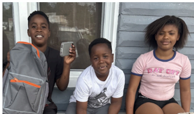
Distribution de sacs à dos