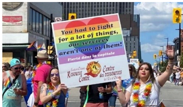
Défilé de la fierté 2023

Le programme de ressources et d'aiguillage a continué à recevoir de nombreuses demandes, notamment pour le programme d'aide aux impayés d'énergie (AIE) d'Hydro, le programme ontarien d'aide relative aux frais d'électricité (POAFE) et notre comptoir alimentaire. Les initiatives saisonnières comme Anges de Noël, Partager la réussite des élèves et le programme d'échange de Noël ont également connu une forte demande, soulignant les difficultés financières persistantes dans notre communauté.