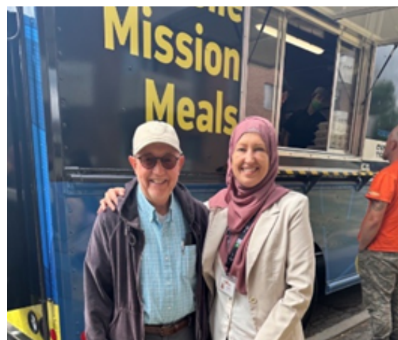
Nouvel arrêt du camion repas de La Mission d'Ottawa