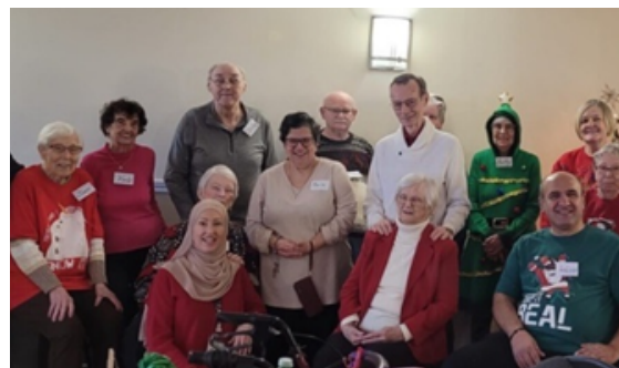
Cercles sociaux pour ainés

Le CREO s'est associé au Gloucester Emergency Food Cupboard pour obtenir 30 000 $ de la Banque alimentaire d'Ottawa visant à améliorer la sécurité alimentaire de nos clients dans les hôtels et refuges. Ce financement a permis à notre nouvelle travailleuse de proximité de livrer des repas congelés et d'améliorer l'accès aux autres services du Centre.