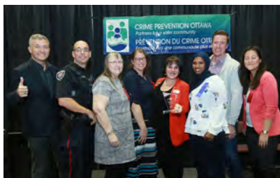
Prix de la prévention du crime