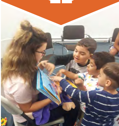
Programme Centre de la petite enfance