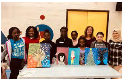
Session de peinture