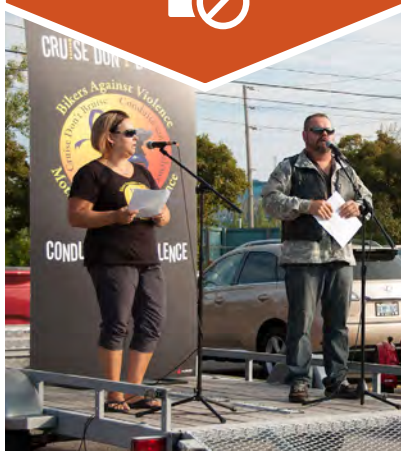
Conduite sans violence