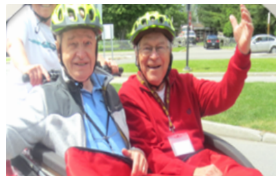
Vélo sans âge