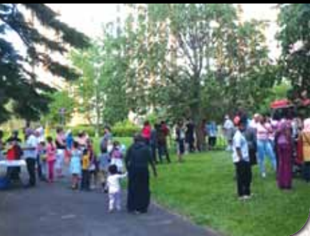
Film dans le parc à Sarratoga

« Les services à l'heure précises et en français. »